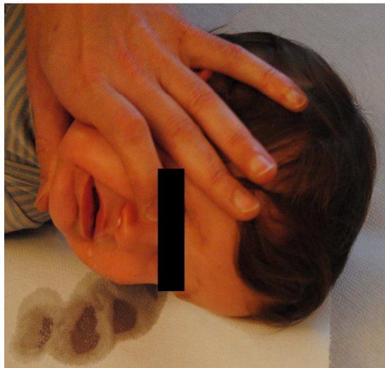
Fermer la bouche de l'enfant en plaquant la langue contre le palais pour laisser sortir le sérum par la narine inférieure