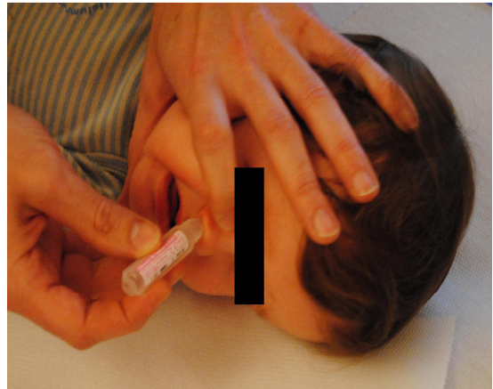
Vider une pipette de sérum physiologique dans la narine supérieure tout en maintenant la tête de l'enfant. Orientez la pipette vers l'arrière de la tête